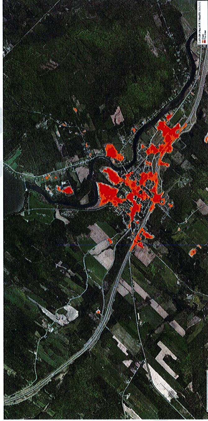
Figure 10 – Localisation des îlots de chaleur dans le périmètre d’urbanisation en 2022